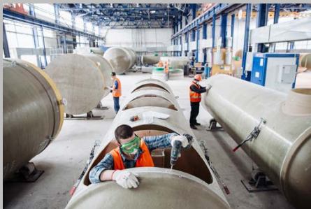
Производство г. Тольятти